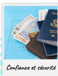
Confiance et sécurité