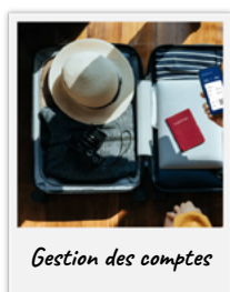
Gestion des comptes

Analyser les intentions des clients, c'est-à-dire les raisons pour lesquelles ils contactent votre centre d'appels, est essentiel pour fournir des résolutions rapides, réduire les efforts, stimuler la croissance et réduire les coûts. Basée sur des millions d'interactions clients, notre bibliothèque d'intentions propriétaire a identifié les six principales raisons pour lesquelles les clients contactent les marques d'hospitalité.