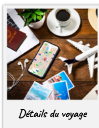
Détails du voyage